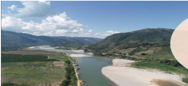
Fotografía N° 1: ZSector Nueva Holanda, se observa que el río Perene se ahorca generando meandros peligrosos para la población y sus cultivos.