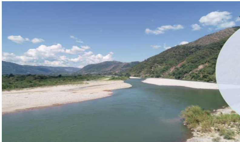
Fotografía N° 2: Sector Bajo Aldea, se observa que el río Perene se ahorca generando meandros peligrosos.